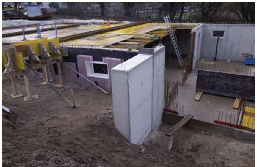
Mit der ersten Sichtbetonwand, die später im Außengelände steht, begann das neue Jahr auf der Baustelle. Links ist die Schalung für einen Unterzug für Balkone zu erkennen.