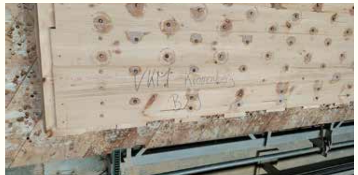
Die ersten Resultate des Werkes im Schwarzwald waren Ende Mai zu sehen. Hier werden für die Dübel die Löcher in die Holzelemente gebohrt. Die Dübel werden nicht mehr geleimt, sondern das Holz ist getrocknet. Damit die Dübel ihren Dienst verrichten können, werden sie angefeuchtet und anschließend in das Loch eingebracht.