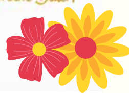
Ein bunter Strauß an Arbeitsthemen.