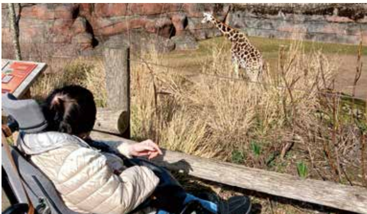
Den Moment genießen und in aller Ruhe einer Giraffe zuzuschauen.