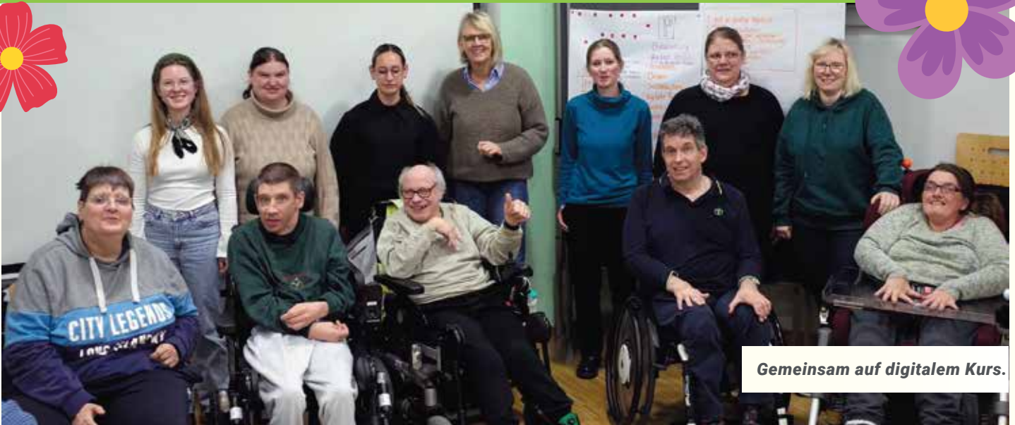
Gemeinsam auf digitalem Kurs.

Alexander Döen | Im April 2025 startete das Projekt „Digitale Teilhabe im KHHH – Ausbau der barrierefreien und unabhängigen digitalen Teilhabemöglichkeiten im Karl-Heinz-Heemann-Haus“ (kurz „Digitalprojekt KHHH“) mit Förderung der SozialstiftungNRW. Zunächst wurden im KHHH die Zimmer mit LAN und stärkerem WLAN versorgt. Wir befragten Bewohner:innen und Mitarbeiter:innen nach ihren Kenntnissen und Wünschen in der Nutzung digitaler Angebote und Medien. Ergebnisse waren, dass es eine große Bandbreite in den Kenntnissen gibt, Internetangeboten ein großes Interesse entgegengebracht wird und Unsicherheiten im sicheren Umgang bestehen. Um für alle die Kenntnisse und Nutzung zu erweitern, wurden fünf Tandems aus Klient:innen und Mitarbeiter:innen im Januar 2026 zu Digitallots:innen durch PIKSL geschult. PIKSL gewann mit ihrem Konzept 2025 den Bundesteilhabepreis. Die fünf Teams haben anschließend schon erste Angebote durchgeführt. So z.B. einen lustigen Musik-Quiz-Abend und auch die Erkenntnis, welche Daten einer Person bei einem Internetdienst gesammelt werden. Dem KHHH stehen zudem nun eine Tablet- und eine Medienstation mit Beamer sowie Leinwand für verschiedenste digitale Angebote zur Verfügung.